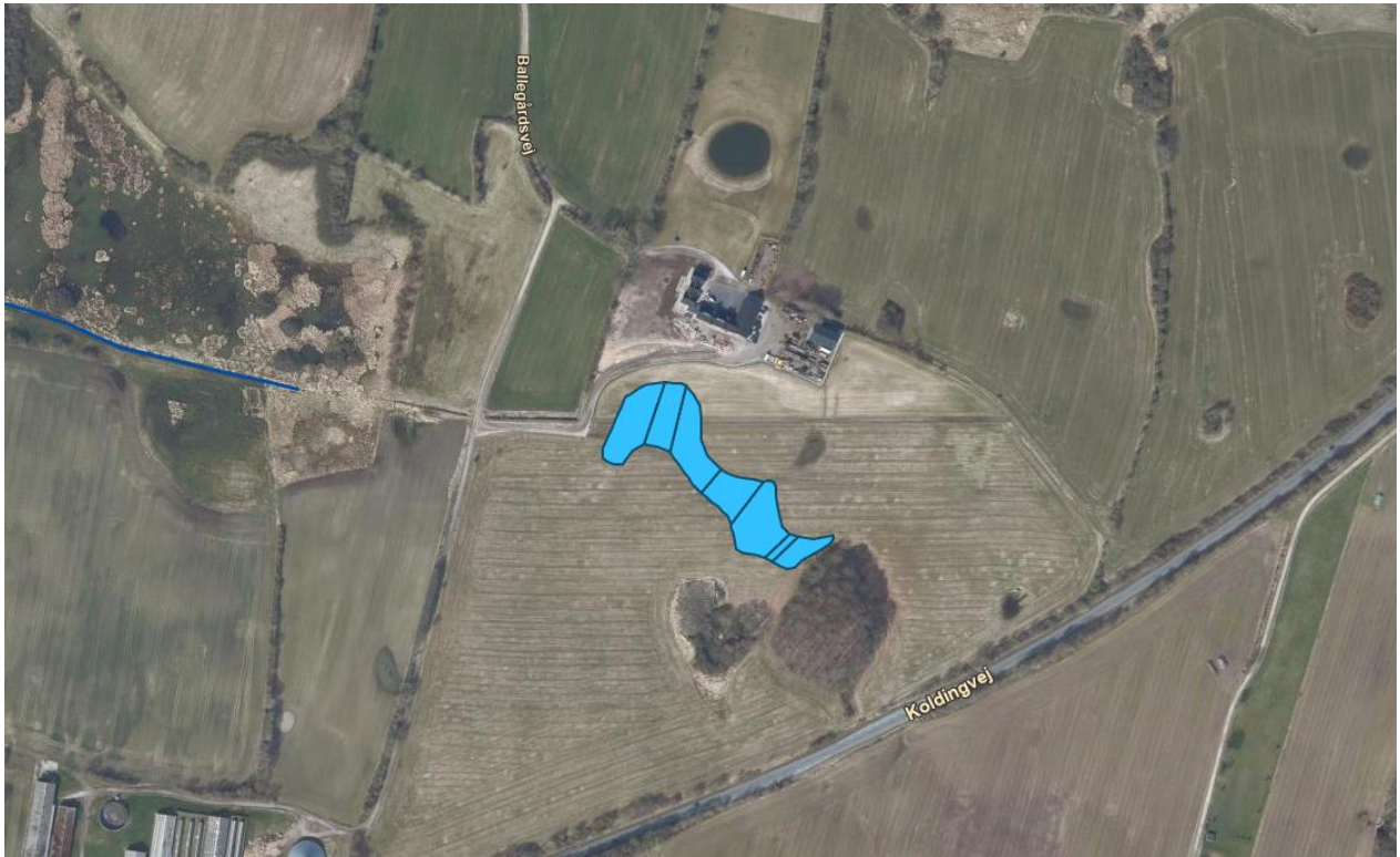
Figur 2: Minivådområdets placering og omtrentlige udstrækning